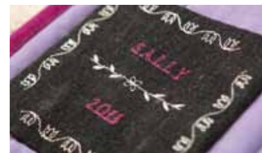
Spiegelvänd, kombinera och spara sömmar och skapa egna vackra mönster. Upp till 4 alfabet. Välj mellan olika stilar.