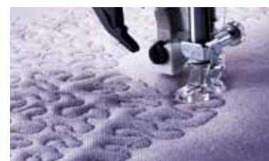
Släpp loss fantasin med frihandssömnad.

I listan över egenskaper finns detaljerad information om varje maskinmodell.